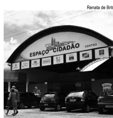
Renata de Brito