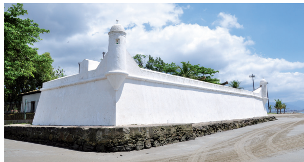
Renata de Brito