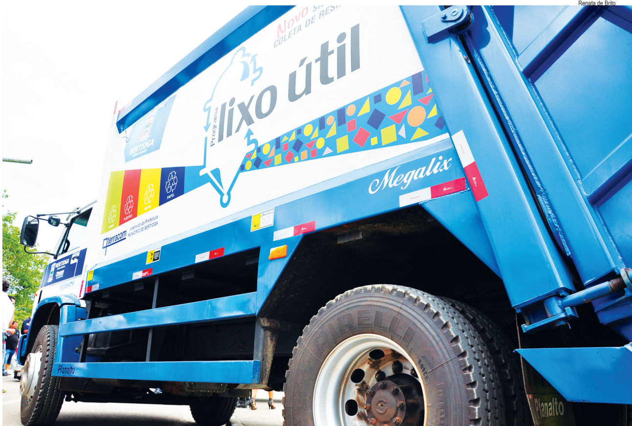
Renata de Brito

Em sua opinião, cada cidadão tem um papel importante na realização do projeto, que só terá êxito se todos colaborarem.