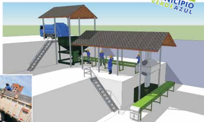
Usina de Triagem, Compostagem e Reciclagem