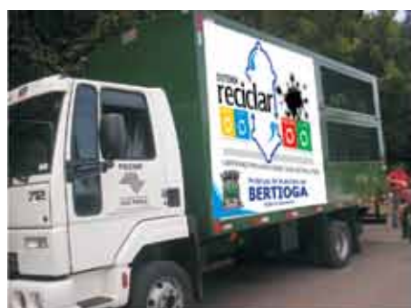
Caminhão de Coleta Seletiva