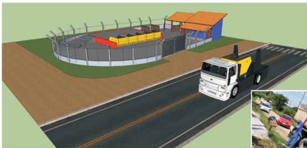
Ecopontos (Ponto de Entrega Voluntária - PEV)