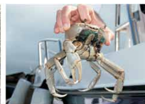
Preservar a fauna e a flora