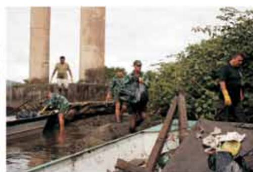
Coleta de Lixo no Mangue