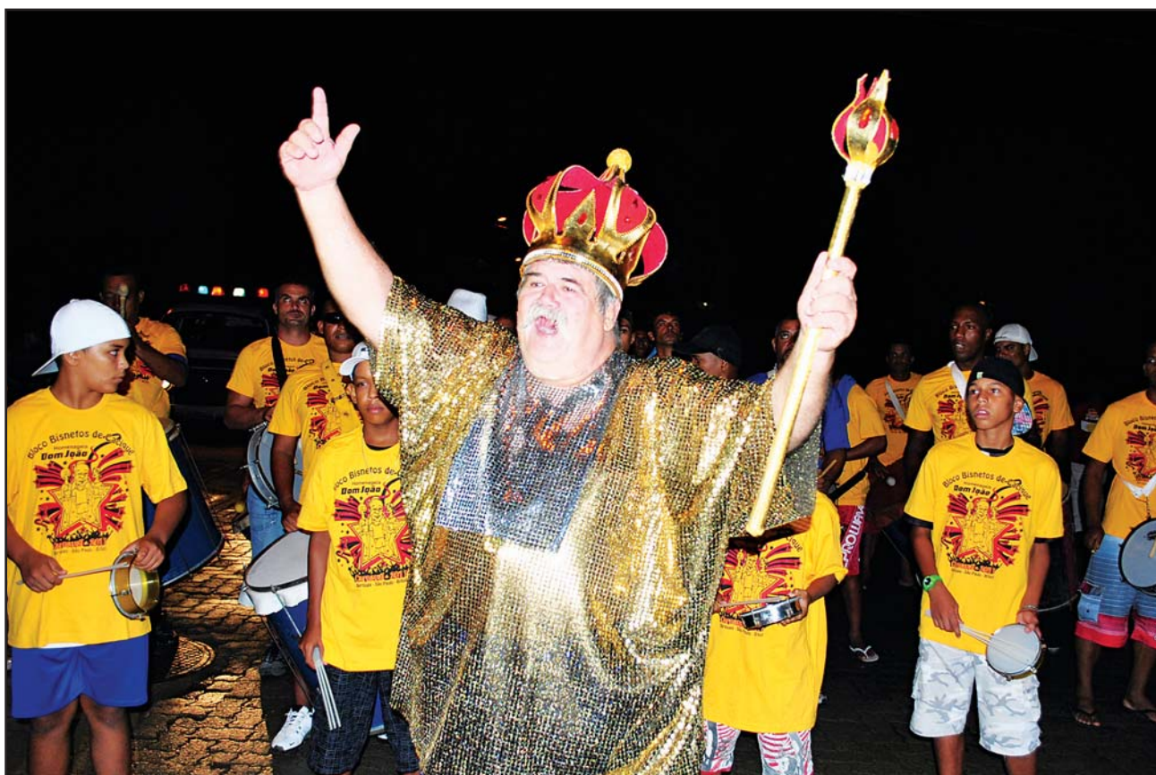
Rei Momo dá as boas vindas aos foliões

Durante os quatro dias de folia, a alegria contagiara a população na Praia da Enseada (Centro), com o tradicional "Carnaval Pé na Areia", onde estará montado um palco, que a partir das 22 horas, animará o público com músicas mecânicas e shows musicais conduzidos pelas bandas Maria Elétrica (dias 05 e 06) e Banana Elétrica (dias 07 e 08).