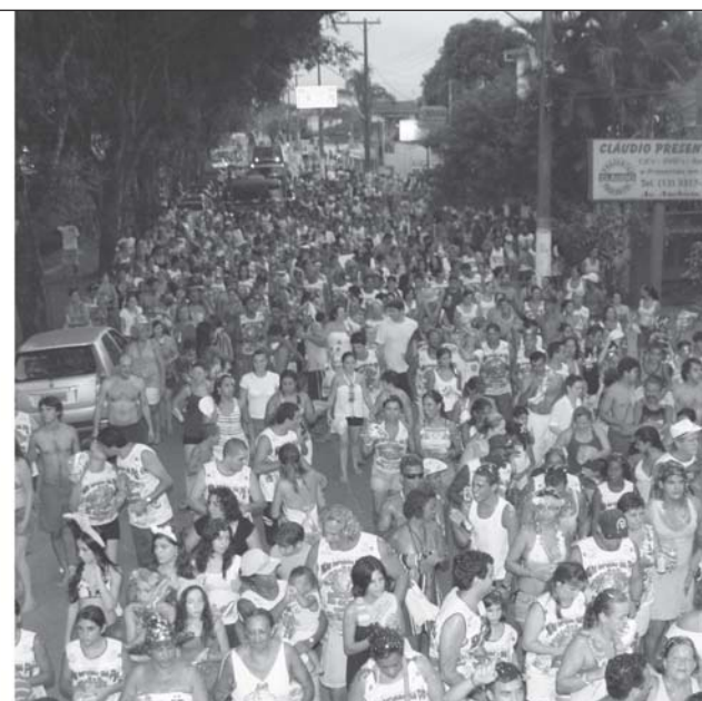
Esquema montado pelo Município visa garantir segurança para os foliões

quanto à higiene e manipulação de alimentos para assegurar momentos de pura diversão aos foliões que ocuparem os espaços públicos durante os desfiles de blocos, bandas e trios elétricos. A fiscalização promete ser intensa junto aos eventuais ambulantes clandestinos, que se aproveitam dessas datas de intenso acúmulo de turistas para comercializarem produtos de forma irregular.