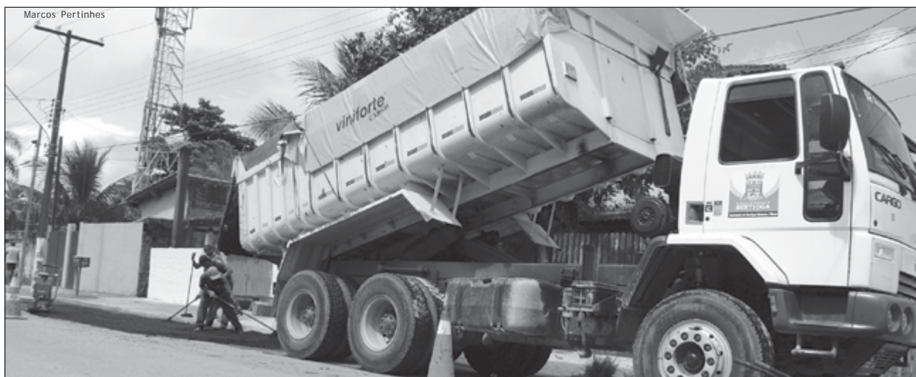
Obras devem ser iniciadas em até 120 dias