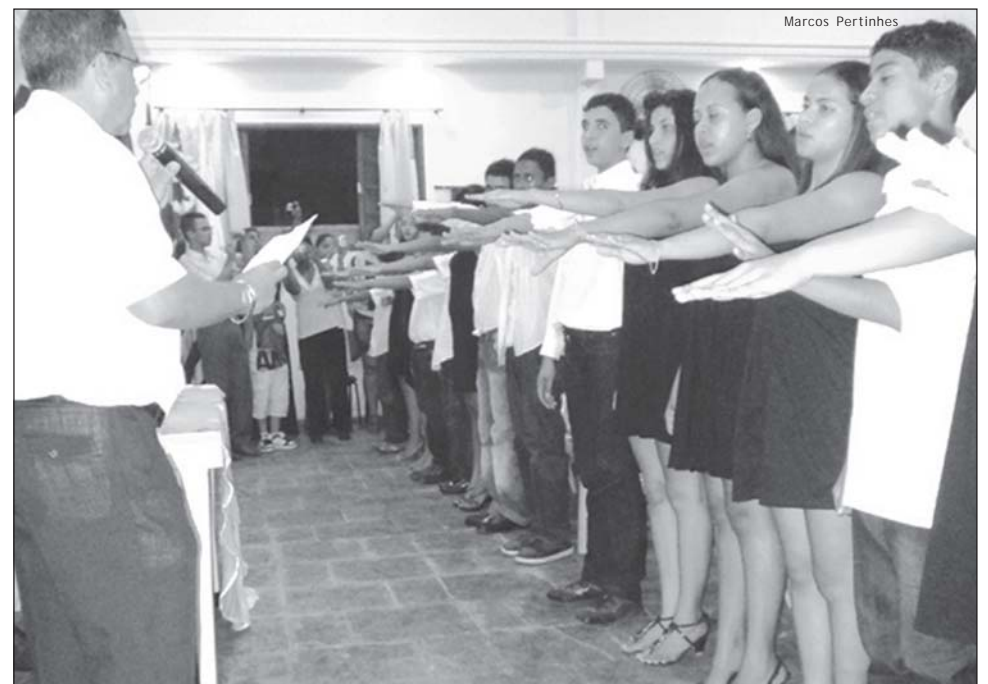
Atualmente, a entidade atende a 64 menores

para o mercado de trabalho atendendo os pré-requisitos da Lei Federal do Menor Aprendiz nº 10.097, de dezembro de 2000.