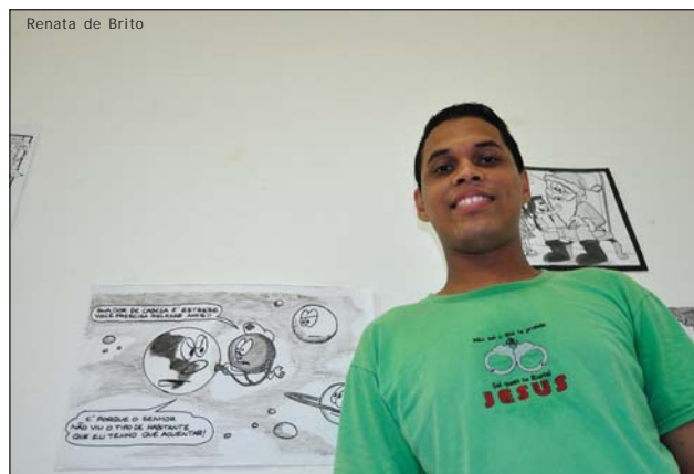
Cartunista é natural de Bertioga

A Casa da Cultura de Bertioga fica na Avenida Thomé de Souza, 130 – Praia da Enseada (Centro). Artistas interessados em expor suas obras devem entrar em contato, indo ao local ou telefonando, de segunda a sexta-feira, das 8 às 17 horas, para agendar a exposição. O telefone para contato é (13) 3317-4060.