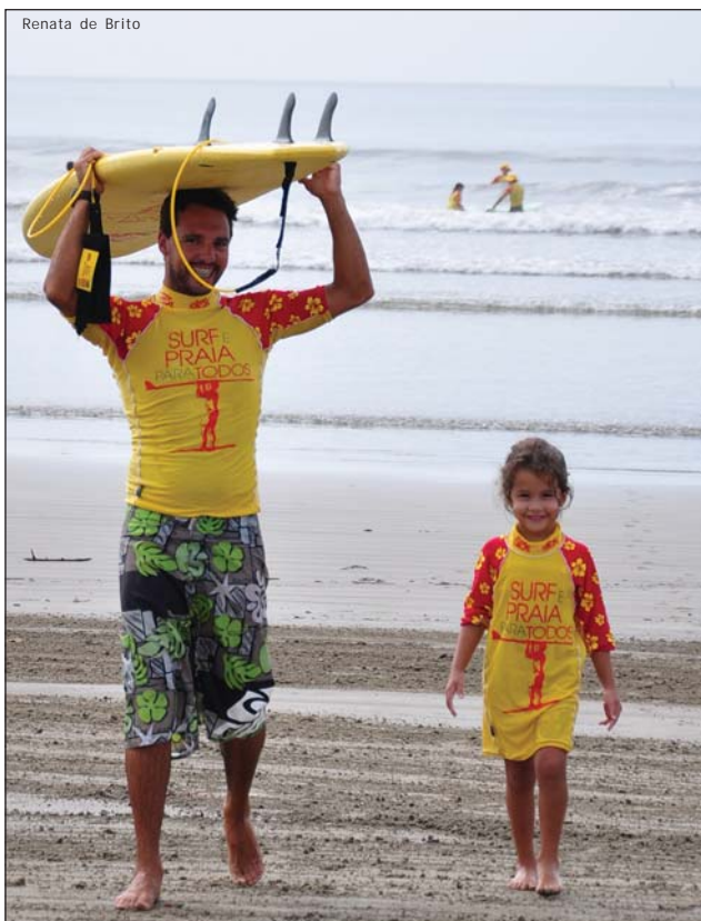
Jovens, adultos e até crianças podem participar