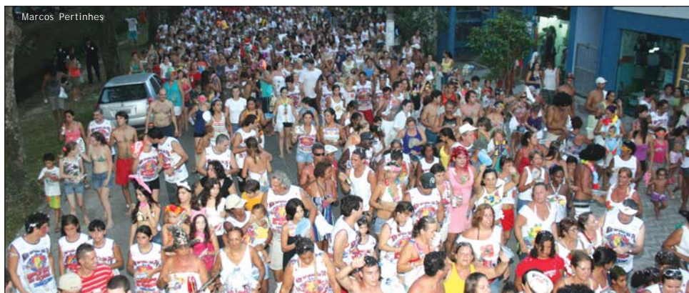
Blocos tradicionais prometem animar turistas e moradores