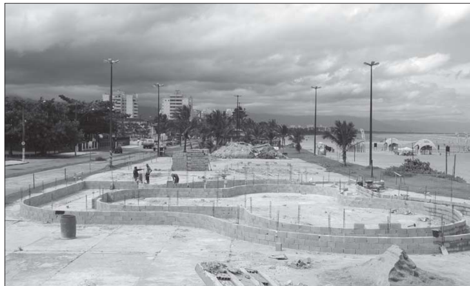
Nova pista de skate começa ganhar forma

Funcionários trabalham no novo posto de observação do Corpo de Bombeiros