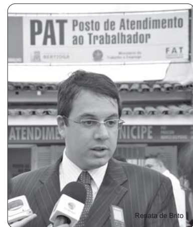
Regata de Brito

Em cerimônia às 15h30, no Gabinete do Executivo, eles assinam a implantação do Sistema Integrado de Licenciamento (SIL), no Município