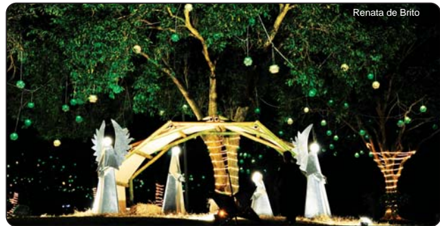
Renata de Brito

De acordo com o prefeito, a contribuição dos homens de rua, artesãos e munícipes que doaram voluntariamente seu dia de trabalho na confecção dos enfeites natalinos, foi