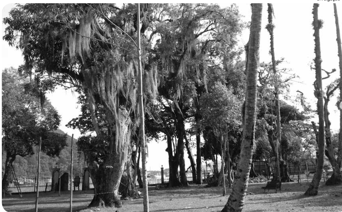
Procedimentos de remoção estão sendo acompanhados por dois engenheiros e um técnico agrícola

Os procedimentos de remoção estão sendo acompanhados por dois engenheiros (agrônomo e florestal) e um técnico agrícola. Conforme o laudo, as árvores encontram-se em estado avançado de deterioração interna e algumas já estão mortas, e por isso é necessária a intervenção. A área foi isolada para garantir a