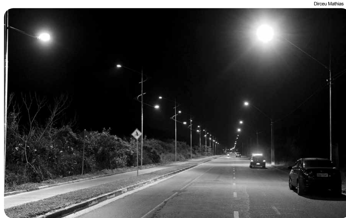
Foram instalados 100 postes com lâmpadas de vapor metálico

Para o médico, Condesmar Marcondes, que utiliza a ciclovia quase todos os dias, além de mais bonito, o local ficou mais seguro. “Passo aqui todos os dias, de bicicleta ou correndo, de dia e de noite, e agora vai ser mais frequente de noite,