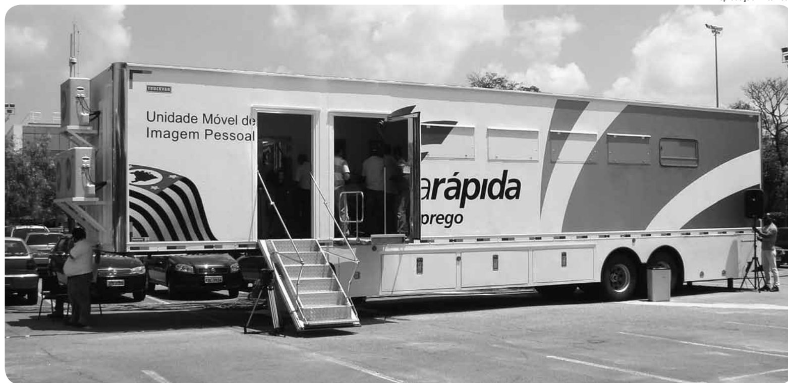
Os cursos, na área de imagem pessoal, serão ministrados na unidade móvel que ficará estacionada em frente ao Espaço Cidadão - Centro

A carreta ficará estacionada em frente ao Espaço Cidadão-Centro e os horários dos cursos são das 8 às 12 horas, das 13 às 17 horas e das 18 às 22 horas, com 20 vagas em cada turma. A carga horária