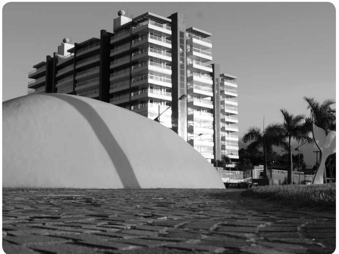
Renata de Brito

A pesquisa da Fipe divulgou também o valor médio do preço do metro quadrado em Bertioga de imóveis usados: R$ 4.944,00. O bairro com o metro quadrado mais valorizado para imóveis novos é a Riviera de São Lourenço, com valores entre R$ 11.000,00 a R$ 12.000,00. E as regiões com menor valor do metro quadrado, também para imóveis novos são Maitinga e Rio da Praia, entre R$ 2.700,00 a R$ 3.800,00.