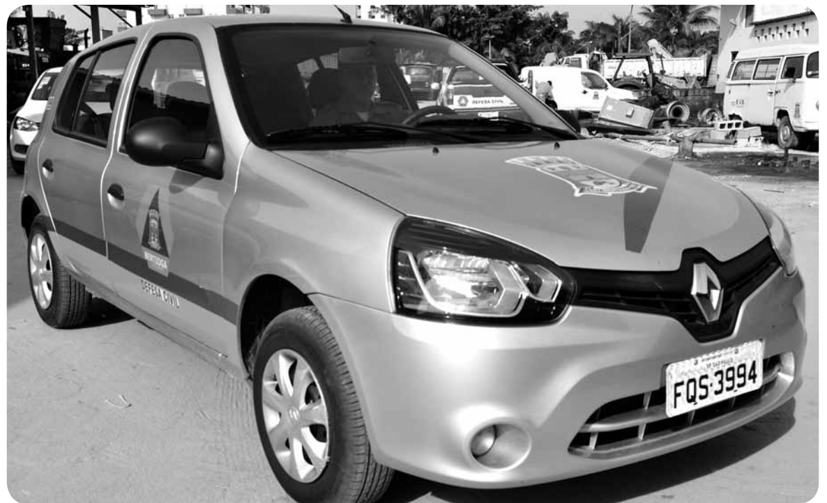
Renata de Brito

A Defesa Civil de Bertioga pode ser acionada pelos munícipes no número 199.