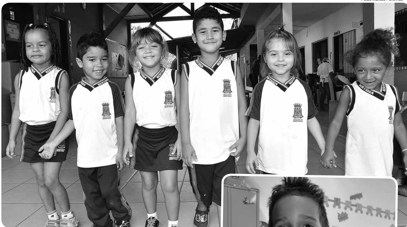
Os kits são compostos por sete peças

A Prefeitura de Bertioga, por meio da Secretaria de Educação, está realizando a distribuição dos kits de uniformes para os alunos da rede municipal de ensino. A entrega nas escolas está acontecendo por lotes, de acordo com disponibilização feita pela empresa vencedora da licitação.