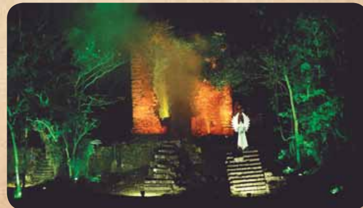
Encenação do "Milagre das Luzes" foi um dos momentos mais marcantes