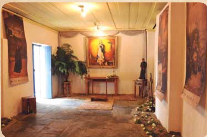
No Forte São João, exposição sobre a vida de Anchieta

Bertioga é a primeira Cidade da região a render homenagens ao mais novo santo do Brasil: São José de Anchieta. Três dias de programação, de 17 a 19 deste mês,