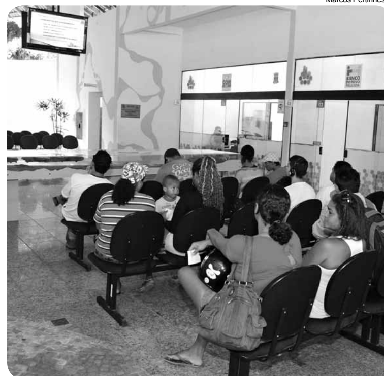
O PAT funciona nas unidades do Espaço Cidadão