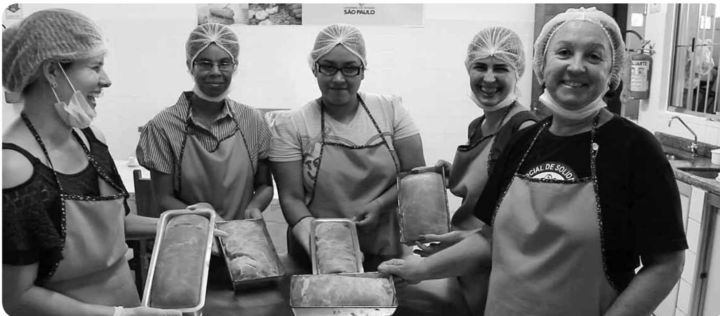
As alunas estão aprendendo a fazer diversos tipos de pães doces e salgados

Com duração de seis meses, a iniciativa tem o objetivo de colaborar com a formação profissional e a geração de renda