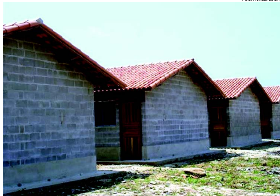
Unidades construídas em sistema de embrião estão praticamente concluídas