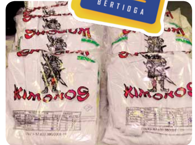
Uniformes e equipamentos esportivos foram entregues

Para se inscrever para os mais de 30 cursos na área de esporte e cultura, disponibilizados pelo Projeto Educando para a Cidadania, basta entrar em contato pelo telefone 3316-2707.