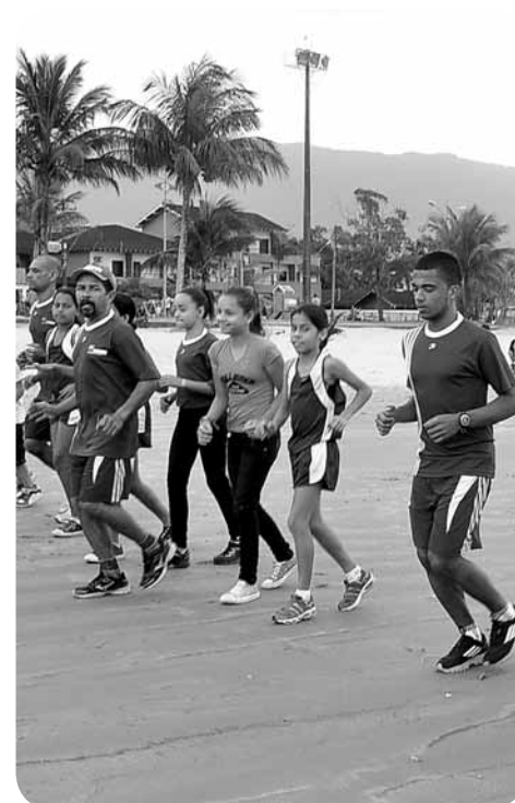
Serão selecionados meninos e meninas com idade entre 10 e 16 anos