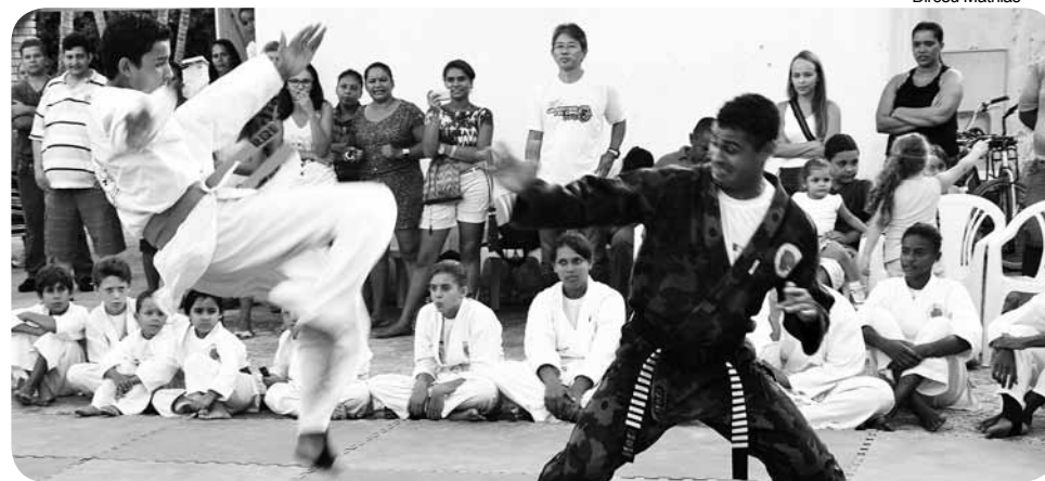
Escolinha atende mais de 80 alunos no estilo Kata Shubu Do Ryu

Participarão da iniciativa os alunos do polo do Bairro Chácara (antiga