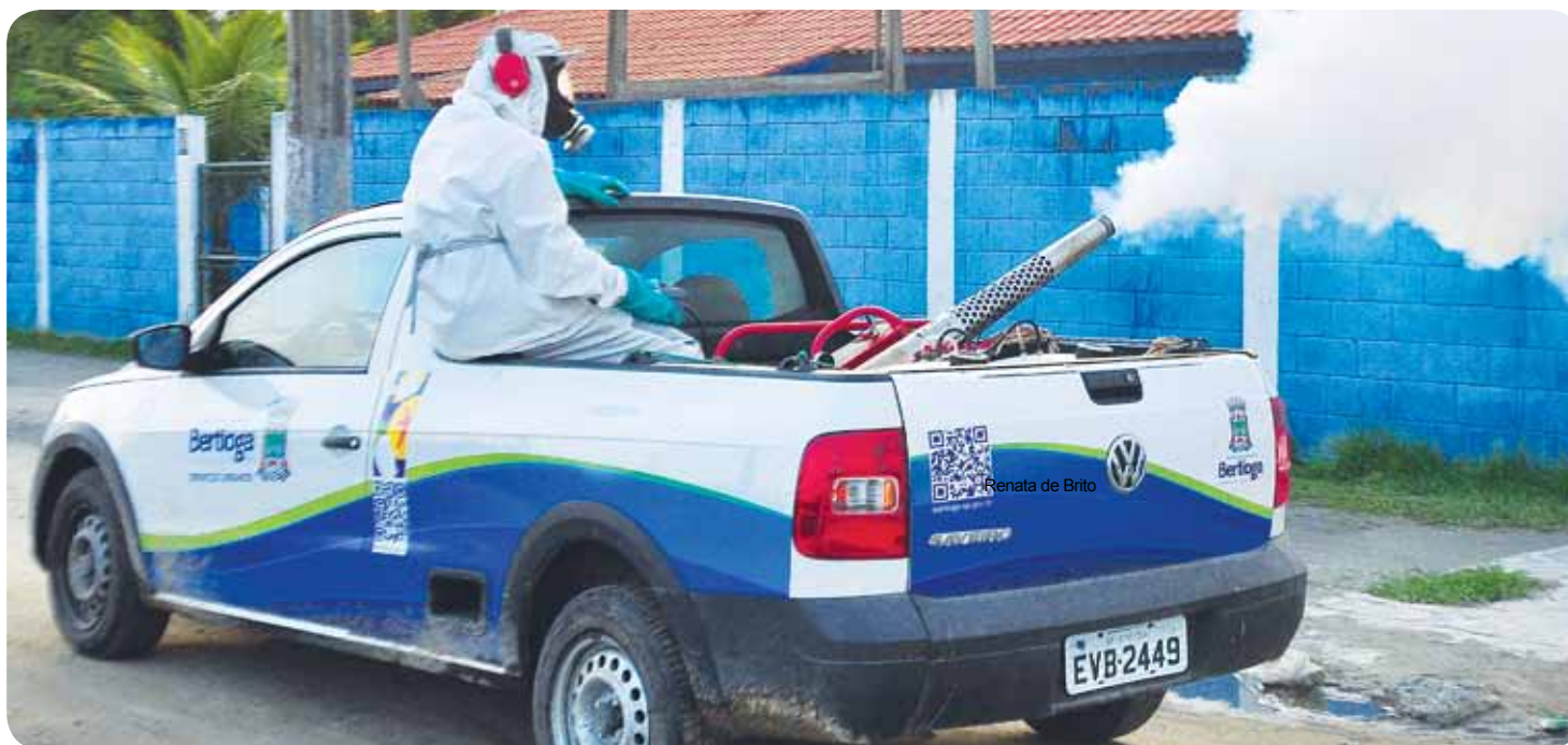
O trabalho de fumacê já realizado pela Prefeitura vai receber reforço da Sucen

Uma ação que representa um importante reforço no combate à dengue em Bertioga acontece na próxima semana, quando dois veículos de nebulização, os chamados fumacês, percorrerão as ruas do Centro na segunda, terça e quarta-feira (14, 15 e 16), das 18 às 22 horas. Em caso de chuva, a ação será transferida para o dia seguinte.