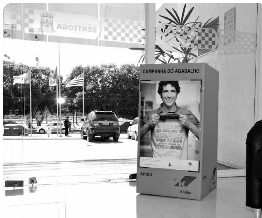
No ano passado o FSS de Bertioga arrecadou mais de 17 mil peças

Informações podem ser obtidas no Fundo Social de Solidariedade de Bertioga, pelo telefone 3317-1397.