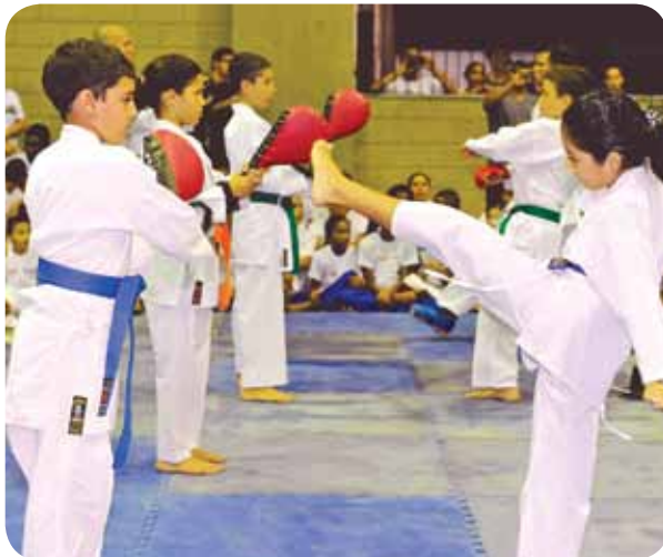
Cerimônia de entrega contou com apresentação dos alunos

Cerca de 300 alunos do Projeto Educando para a Cidadania, desenvolvido pela Prefeitura de Bertioga, das modalidades esportivas de Judô, Capoeira e Karatê, receberam uniformes e equipamentos esportivos novos nesta quarta-feira (09), no Ginásio de Esporte.