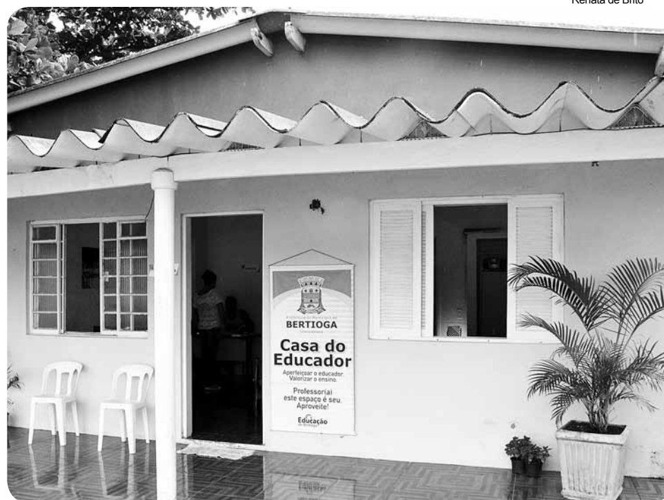
Casa do Educador está funcionando na Avenida Henrique Costábile, 206, no Centro

O pilates é um método de condicionamento físico e mental, que conta com exercícios suaves que proporcionam alongamento e a fortificação do corpo. Melhora a respiração, diminuir o estresse, desenvolver consciência e equilíbrio corporal. A atividade está à disposição todas às sextas-feiras, em quatro turmas, duas de