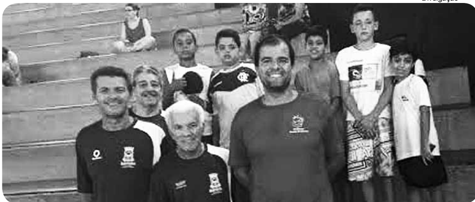
Bertiogenses ficaram saitsfeitos com a premiação

A equipe de tênis de mesa de Bertioga conquistou expressivas colocações no último domingo (30), durante o Festival Santista de Tênis de Mesa. A competição contou com a participação de aproximadamente 200 atletas de toda Baixada Santista e aconteceu nas dependências do Ginásio do Sesc, em Santos.