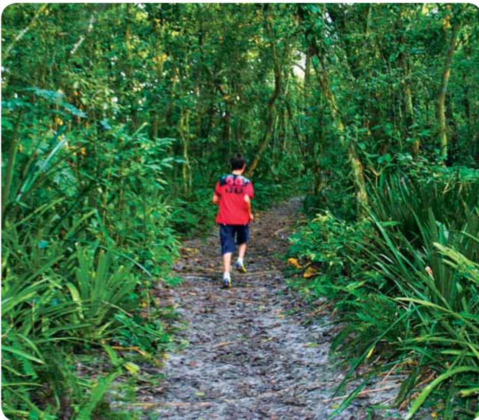
Conselheiros consideram que as trilhas ecológicas constituem um importante produto para o turismo

As cinco trilhas ecológicas, localizadas no Parque Estadual Restinga de Bertioga (Perb), ainda não podem ser utilizadas. Isto porque, mesmo com a aprovação do Plano Emergencial de Uso Público, elaborado pelo Conselho Consultivo do Perb, por parte da Fundação Florestal (FF), órgão do Governo do Estado responsável pela administração do Parque, ainda resta a assinatura de um termo de convênio entre a Prefeitura de Bertioga e o Estado.