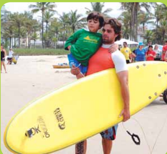
Escola também oferece atividades voltadas ao esporte adaptado, usando as praias de Bertioga como ambiente ideal