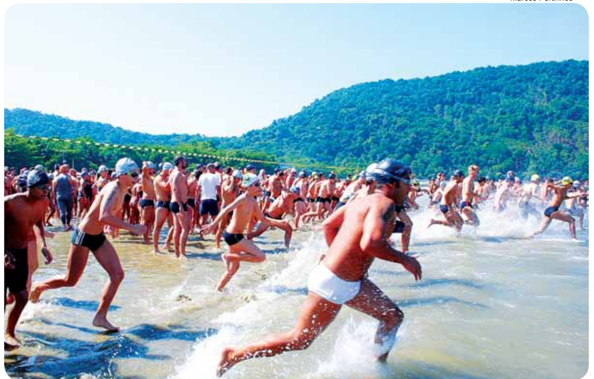
Com largada a partir das 9 horas, a prova consiste em percursos com distâncias de 3 km