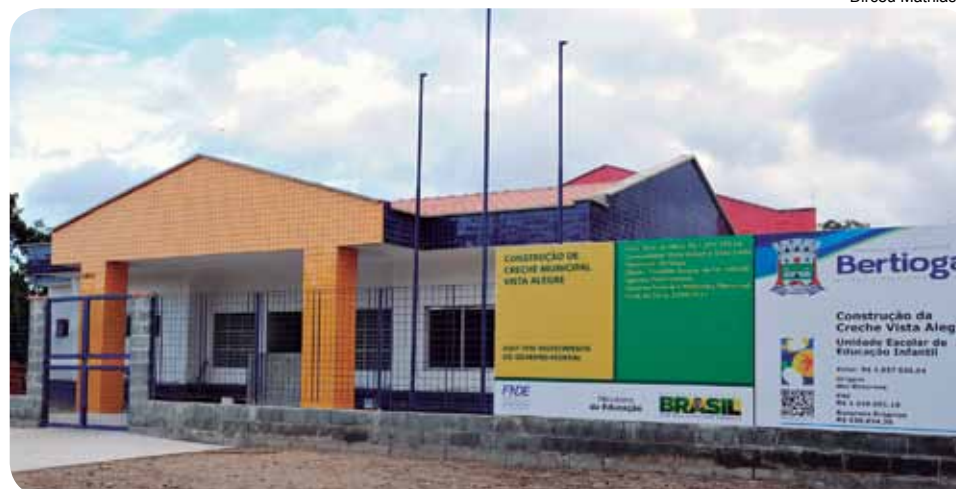
Unidade que será inaugurada na Vista Alegre poderá ser administrada por meio de convênio

região onde será instalada a creche. Também deverá ser comprovada a vantagem financeira para o Município com relação às despesas de instalação e custeio da creche. Todos os convênios a serem celebrados deverão ter aprovação do Plano de Trabalho pelo Conselho Municipal de Educação.