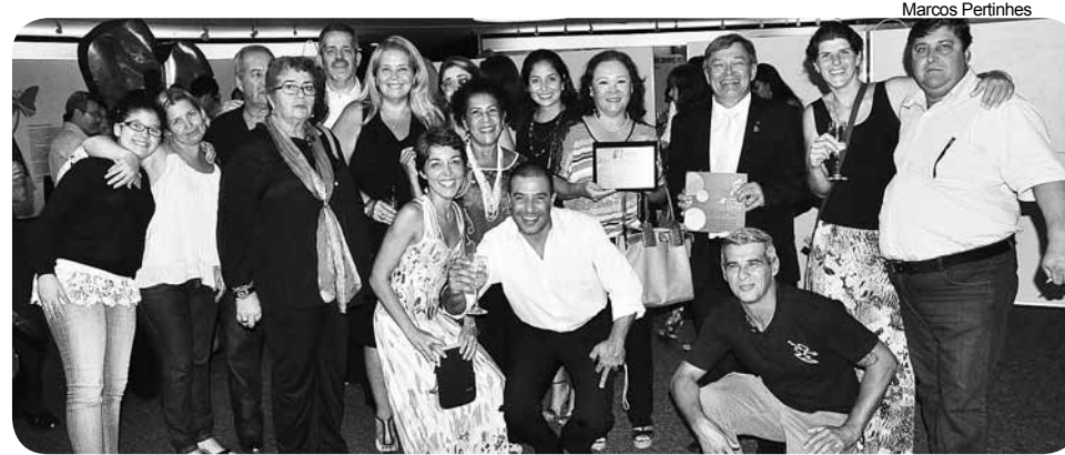
Representantes da Prefeitura e de entidades parceiras participaram da cerimônia de entrega do prêmio

Entre as 10 ações inclusivas selecionadas e premiadas está o projeto da Prefeitura de Bertioga, 'Práticas Adaptadas Interiores e Exteriores' (realizadas em locais abertos e fechados), desenvolvido no Município pela Diretoria de Acessibilidade e Inclusão (DAI), vinculada à Secretaria de Segurança e Cidadania. A premiação aconteceu, no Memorial da Inclusão, na sede da Secretaria de Estado dos Direitos da Pessoa com Deficiência, na capital paulista. No total,