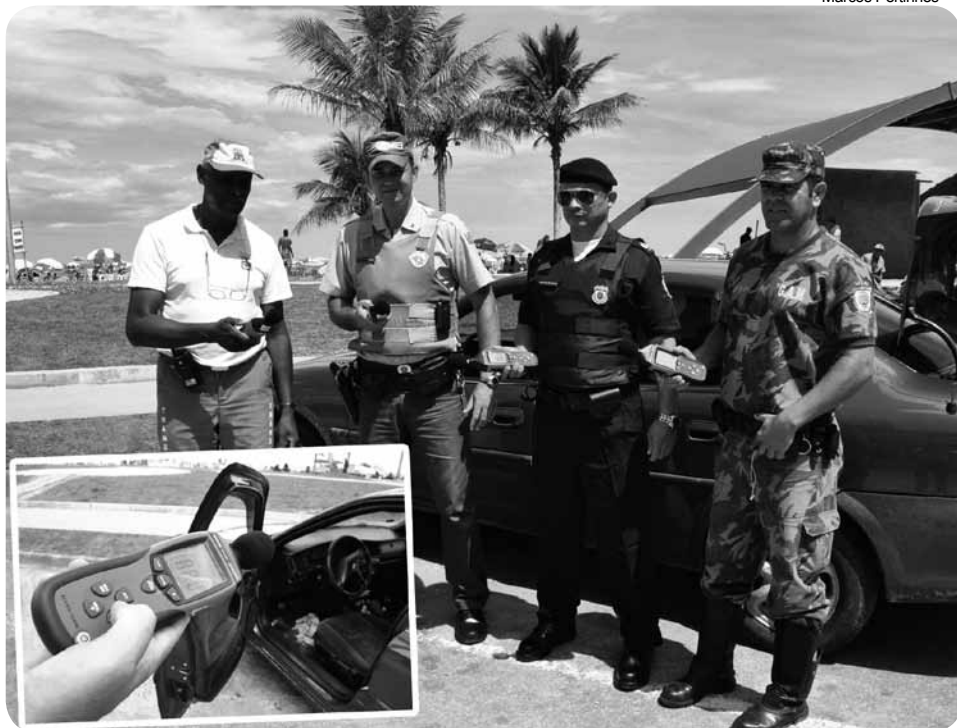
Faixas alertam sobre critérios de poluição sonora

Uma legislação que dispõe sobre medidas de combate à poluição sonora já está em vigor em Bertioga. A Lei 1.501 trata sobre ruídos urbanos, proteção do bem estar e do sossego público estabelecendo critérios para a emissão de sons, inclusive com horários e a intensidade dos ruídos.